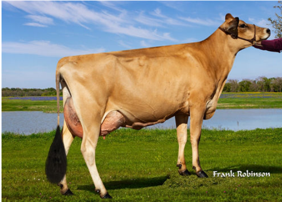
JX LUCKY HILL WILDFLOWER {6} GRANDDAM

RIVER VALLEY MAC MARGIN VIERRA JASMINE VG-85%-2YR-USA KASH-IN SUGAR DADDY JX LUCKY HILL WILDFLOWER {6} EX-90%-5YR-USA JX AHLEM HARRIS BALTAZAR {5} LUCKY HILL BALLISTIC WINNIE VG-85%-3YR-USA